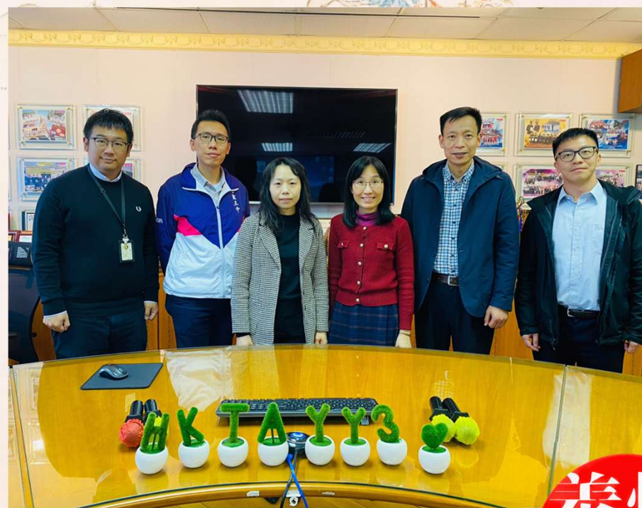
教育局支援人員與本校核心小組成員

促進多個科組以 中華文化 為主軸，在課堂內外的多元學習經歷，加強學生（包括非華語學生）對「 惜物養德 」的認識，讓學生踐行「節儉」這中華民族的傳統美德。