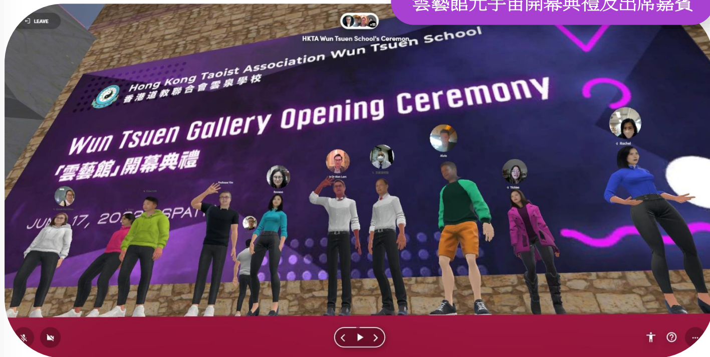
雲藝館元宇宙開幕典禮及出席嘉賓