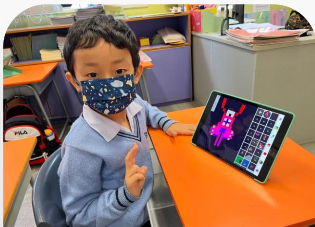
Voxel Art 教學單元