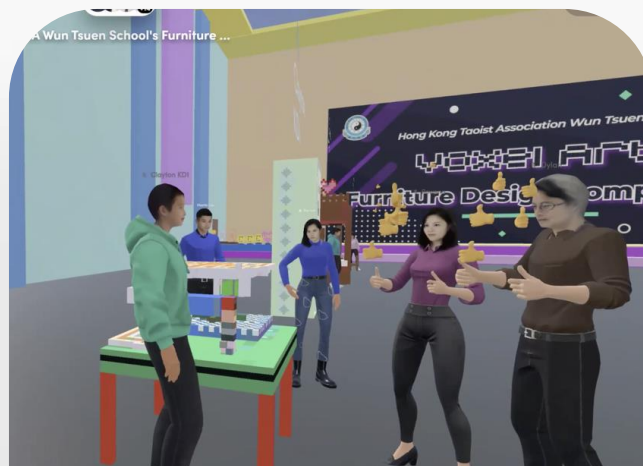
Voxel Art 傢俬設計比賽