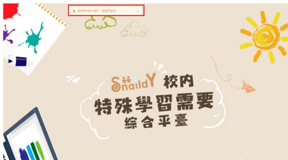
(圖 2.1-3: 系統自動登出提示 – 長時間沒有活動)

任何帳戶(包括「超級管理員」)同一時段只能被一位使用者登錄，系統將會按時間順序，把較先登入的使用者彈出至登錄頁面，並顯示「系統偵測到帳戶同時於另一台裝置登入，因此本裝置已被強制登出；如不是你本人操作，請立即聯絡學校的「超級管理員」協助重設密碼或與 Snaily 聯繫(3500 7342)。」的提示字句。(圖 2.1-4)