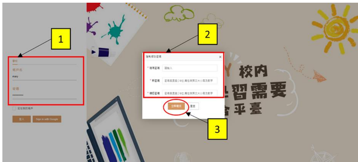
(圖 2.2-2: 首次登入 – 強制修改密碼)

帳戶使用者收到確認電郵後，須在登入頁面進行 首次登入程序 。在登入頁面中輸入預設「 帳戶名稱 」及「 密碼 」後，按「 立即提交 」彈出「 強制修改密碼 」視窗，系統會強制要求用戶 輸入新的密碼 。（圖 2.2-2）