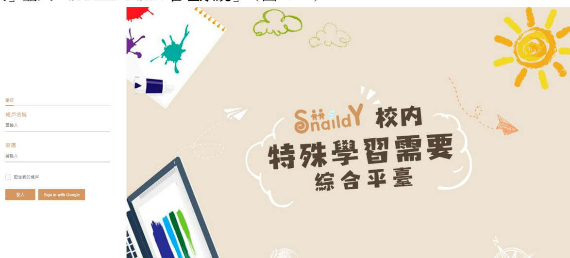
(圖 2.1-1: SNAILDY 系統登入頁面)

在登入頁面中，學校用戶須在「登錄」欄位輸入「帳戶名稱」及「密碼」，然後按「登入」登入「SNAILDY SEN 管理系統」。(圖 2.1-1)