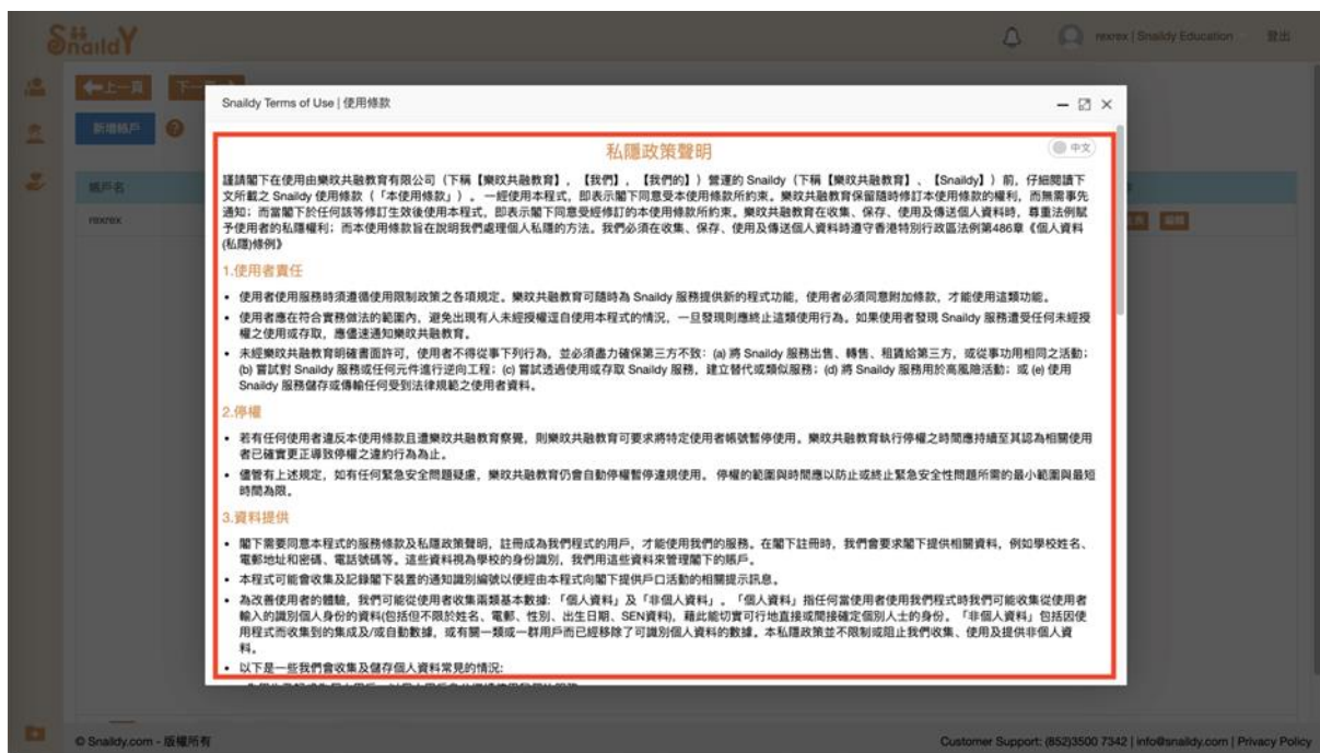
(圖 2.2-4: 首次登入 – 私隱政策條款)