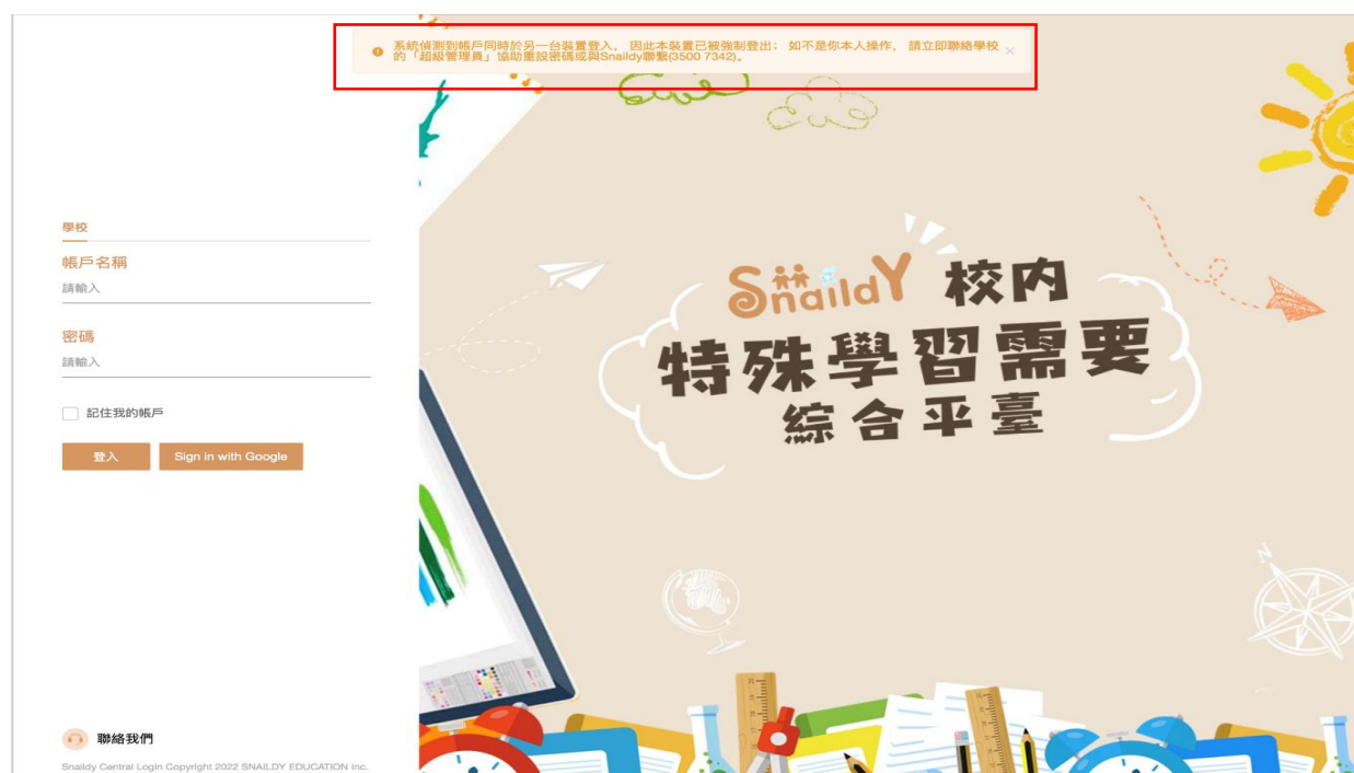
(圖 2.1-4: 系統自動登出提示 – 多位使用者登錄同一組帳戶)

任何帳戶(包括「超級管理員」)同一時段只能被一位使用者登錄，系統將會按時間順序，把較先登入的使用者彈出至登錄頁面，並顯示「系統偵測到帳戶同時於另一台裝置登入，因此本裝置已被強制登出；如不是你本人操作，請立即聯絡學校的「超級管理員」協助重設密碼或與 Snaily 聯繫(3500 7342)。」的提示字句。(圖 2.1-4)