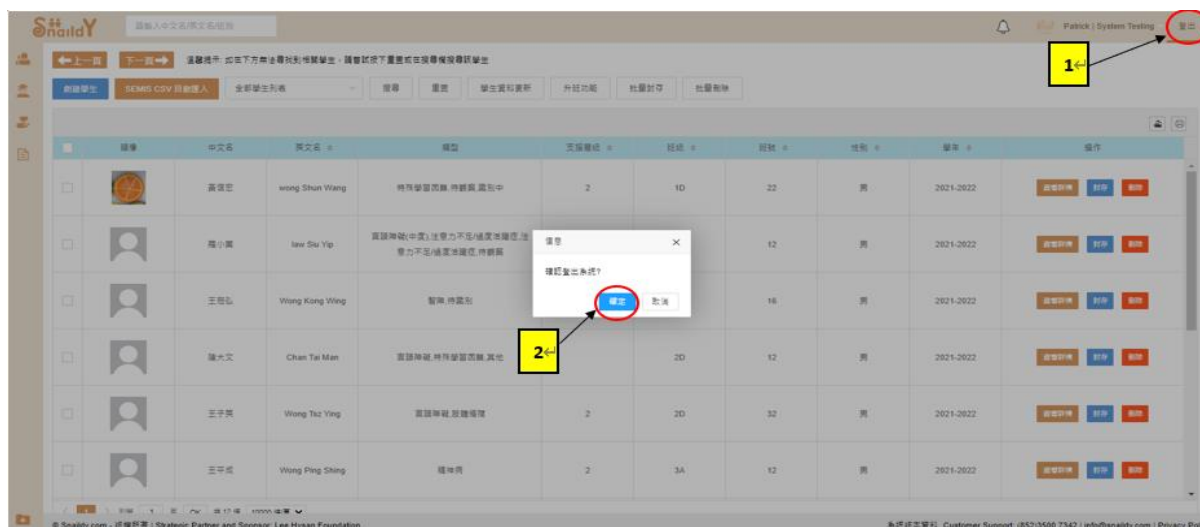
(圖 2.1-2: 系統登出操作)

此外，登出系統時可按右上方「登出」。系統會顯示訊息「確認登出系統？」，按「確定」以確認登出操作。(圖 2.1-2)