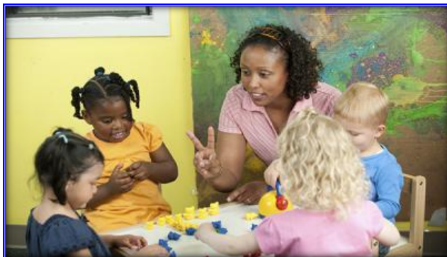
全班教學 / 小組教學