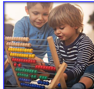
老師指導 / 朋輩指導